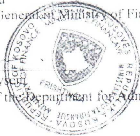
Translation Division in Ministry of Finance, Labour and Transfers